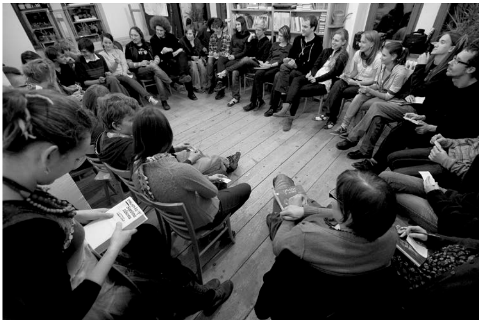
Dny mládeže v Soběhrdech