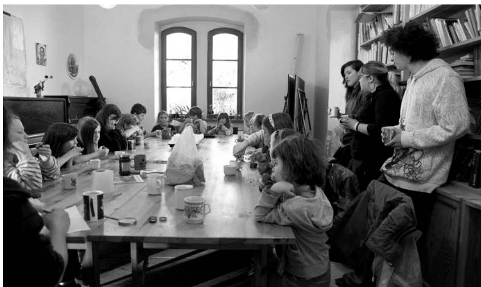
Víkendovka pro děti