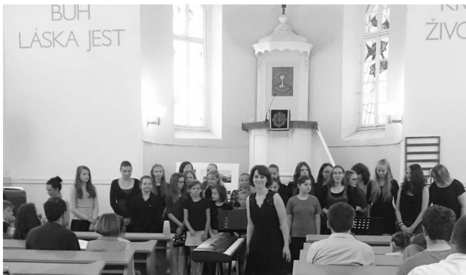
Benešovská ZUŠ Karlov