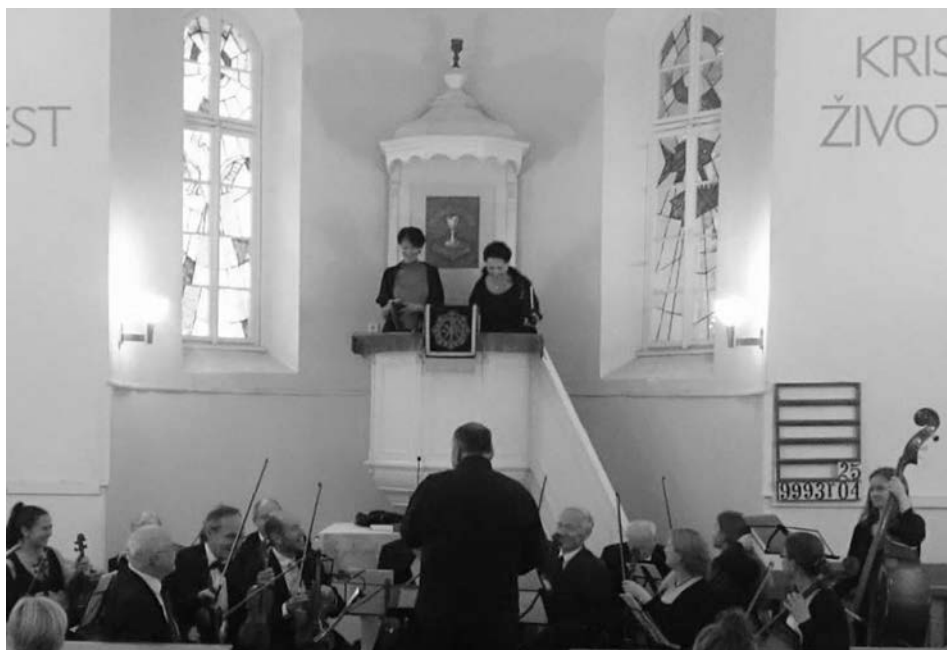
Říčanský komorní orchestr