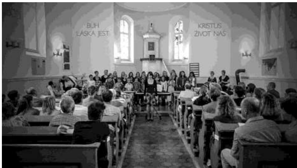
dětský pěvecký sbor