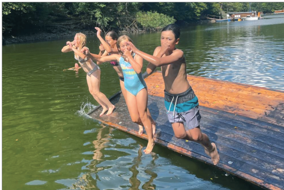
Táborové cachtání na platu, Luh u Čími, srpen 2024.