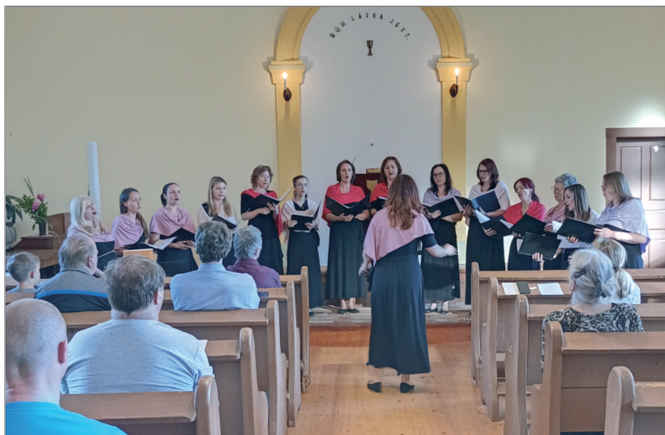
Sukův komorní sbor, Noc otevřených kostelů, Prčice, červen 2024.