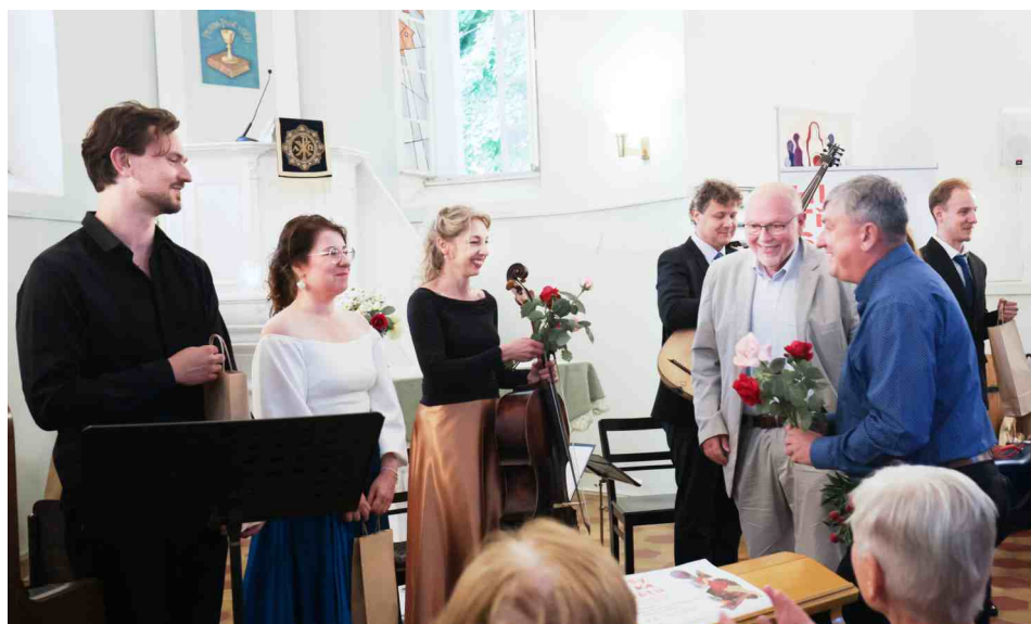
Koncert Cestopísně, Soběhrdy červen 2026.