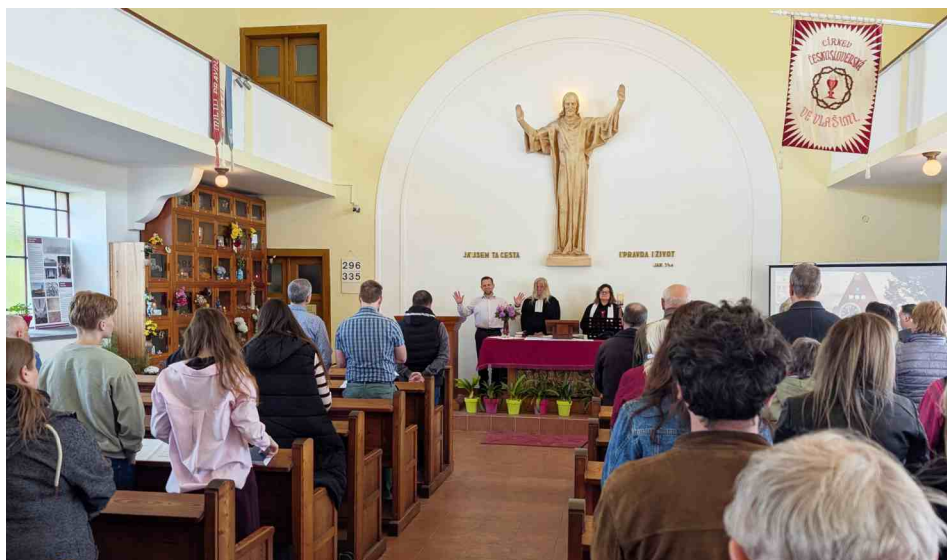
Ekumenické bohoslužby ve sboru CČSH. Vlašim květen 2026.