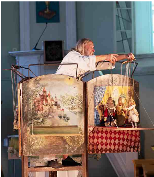
Noc kostelů v Prčici a v Soběhrdech, červen 2026.